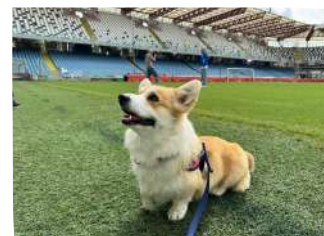
WELSH CORGI PEMBROKE

l'area ospita inoltre una pensione/asilo cani di 30 posti, a norma AUSL e comunale