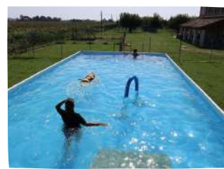
PISCINA 12 X 6

il centro si trova all'interno di un'area di 25.000 mq che ospita l' allevamento di 3 razze :