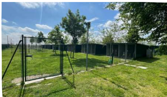
PENSIONE - ASILO PER CANI

l'area ospita inoltre una pensione/asilo cani di 30 posti, a norma AUSL e comunale