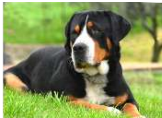
GRANDE BOVARO SVIZZERO